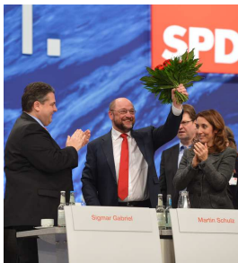
Martin Schulz, MdEP